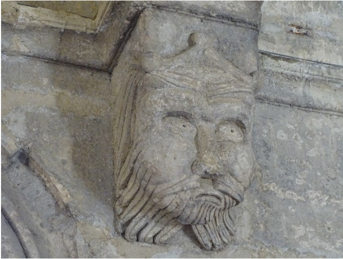
01. console du cloître, CMN

Nous verrons donc d'abord comment l'Eglise se sert du bestiaire avant d'énumérer, selon les modèles de cette époque, les grandes catégories d'animaux.