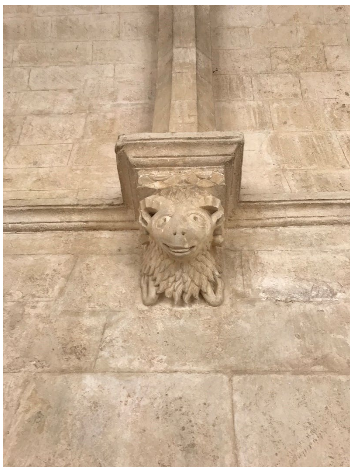
o5. bélier, CMN

Dans la galerie Est, nous observons un avant corps de bélier. Portant une clochette au cou, symbole d'une nature dominée et clémente, il se présente ici comme conducteur de troupeau. Soupçonné d'entretenir des liens avec les religions païennes, il perdra cette image au profit du bon pasteur.