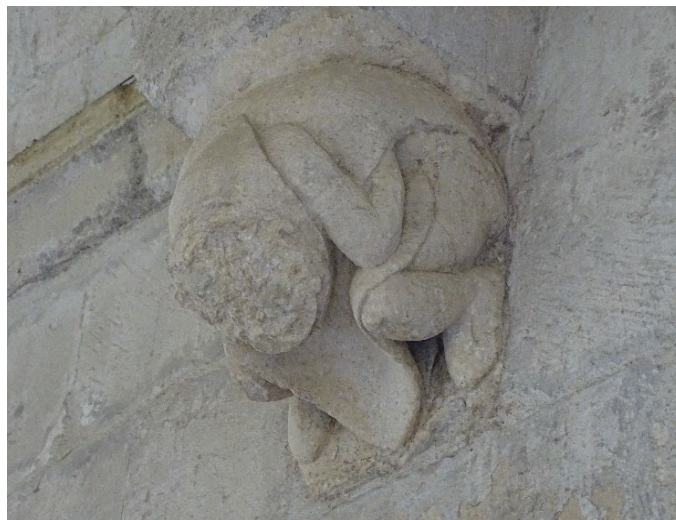
03. Console du cloître, CMN

Il est très important de noter que toutes ces créatures font partie de l'œuvre du Créateur et servent à montrer que l'on est en train de franchir les limites. Elles polarisent les peurs de l'homme : angoisse de voir son intégrité corporelle remise en cause à chaque naissance en raison de l'action « déformante » du péché, effroi devant le châtement divin qui viendra inmanquablement en résulter, crainte de voir l'équilibre social s'effondrer, frayeur de dépasser le cadre rassurant du monde habité.