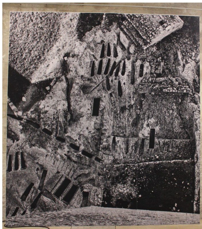
01. tombes rupestre, abbaye de Montmajour, lucien Clergue, 1955