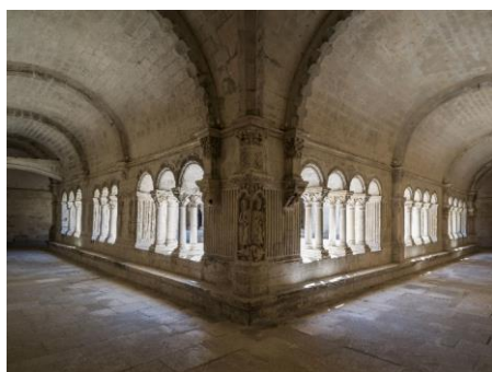
Abbaye de Montmajour, cloître.

Située à 4 km au nord-est d'Arles, l'abbaye bénédictine de Saint-Pierre de Montmajour se dresse sur un pic rocheux haut d'une quarantaine de mètres. Le panorama à 360 ° y est époustouflant dominant ainsi le pays d'Arles. On aperçoit au loin la chaîne des Alpilles, Arles, Tarascon, et par grand beau temps la Sainte Victoire.