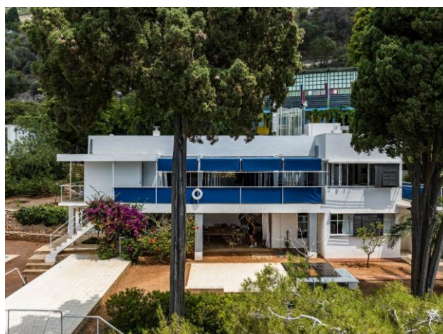
Cap Moderne, Eileen Gray et Le Corbusier au Cap Martin (Roquebrune-Cap-Martin), Villa E-1027 (Roquebrune-Cap-Martin) © Eileen Gray, © Jean Badovici © We are Content(s) / Centre des monuments nationaux

Pour en savoir plus sur la villa E-1027 et l'ensemble des bâtiments de Cap Moderne rendez-vous sur leur site internet www.capmoderne.monuments-nationaux.fr