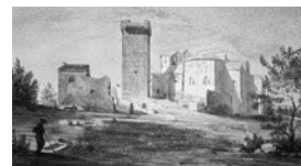
La abadía en 1846, obra de Révoil

A las puertas de Arlés, sobre un peñasco que emerge de las marismas, el Mont Majour*, se establece una